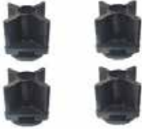
Zemin Pabuçları 4 Adet