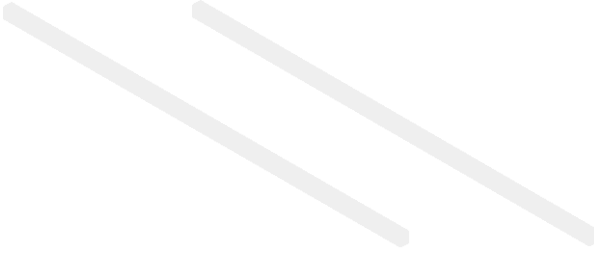
Travers 2 Adet