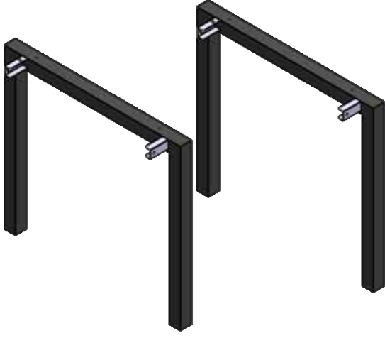
Masa ayağı modeli U 2 Adet