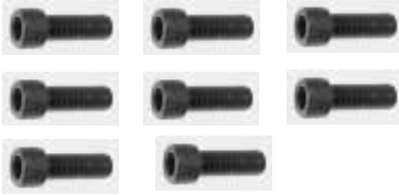
Vidalar M8 x 20 8 Adet